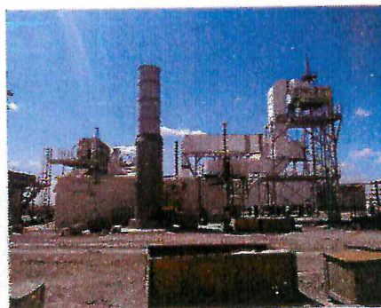
ГПА-08-01 серии «Иртыш» ДКС «Самантепе» АО «Узбекнефтегаз»

С учетом действующих в ПАО «Газпром» новых требований о сертификации продукции и услуг в СДС ИНТЕРГАЗСЕРТ, осуществляется активная фаза работ по сертификации производства и образцов продукции ИНГК в рамках подписанного договора с СЦ «ВНИИГАЗ Сертификат» и ведется работа по сертификации системы менеджмента качества (СМК) и оценке деловой репутации (ОДР) в рамках договорных отношений с АС «Русский регистр» (положительно завершена второй этап, сертификат соответствия СМК в ИНГК требованиям СТО Газпром 9001-2018 выдан 29.07.2019 со сроком действия по 28.07.2022).