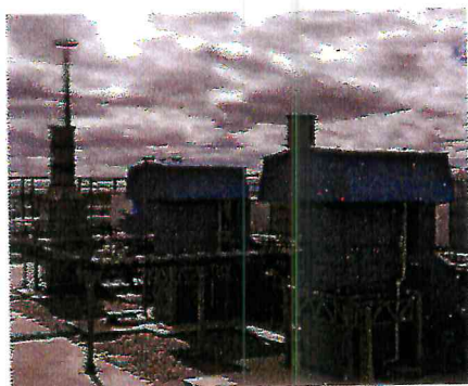
ГПА-06-01 и ГПА 10-01 серии «Иртыш» Уренгойского ЗПКТ ООО «Газпром переработка»